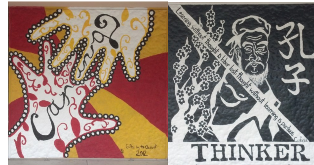
Murales de perfil estudiantil diseñados por estudiantes de Wiltsey

El perfil del estudiante IB es la declaración de la misión de BI traducida a un conjunto de resultados de aprendizaje para el siglo 21. El perfil del estudiante provee una visión de su educación a largo plazo. Es un conjunto de ideas que pueden inspirar, motivar, y enfocar en el trabajo de las escuelas y maestros, uniéndolos en un propósito común. Mediante estos perfiles de estudiantes, los alumnos se esfuerzan por ser investigadores, pensadores, comunicadores, audaces, cultos, reflexivos, equilibrados, de mente abierta en íntegros.